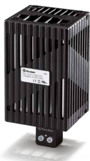
Typ 7H.51.0.230.0100 Effekt 100 W