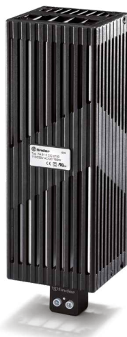
Typ 7H.51.0.230.0150 Effekt 150 W